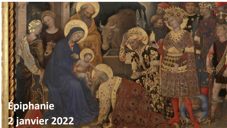
Épiphanie 2 janvier 2022